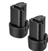
バッテリーパック SI-B1212LA(2個)