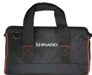
キャンバスバッグ