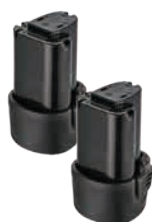
バッテリーパック SI-B1212LA (2個)