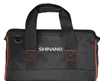
キャンバスバッグ