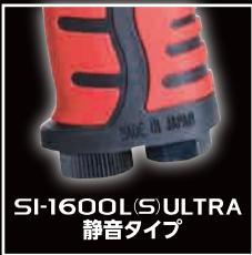
SI-1600 L(S) ULTRA 静音タイプ