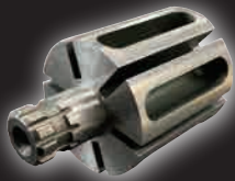
新構造ローター 特許出願中

ジャンボシングルハンマー式 1回転1打撃方式。 シンプルな構造で大きなパワーを 生み出します