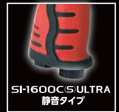
SI-1600 C(S) ULTRA 静音タイプ