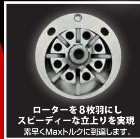
ローターを8枚羽にし スピーディーな立上りを実現 素早くMaxトルクに到達します。