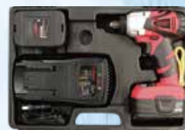
専用キャリングケース