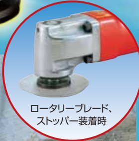
ロータリーブレード、 ストッパー装着時