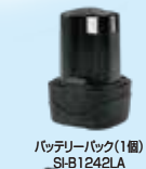
バッテリーパック(1個) SI-B1242LA