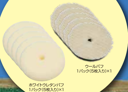
ホワイトウレタンパフ 1/パック(5枚入り)×1